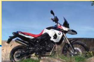
BMW F 800 GS SE