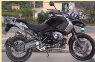
BMW R 1200 GS