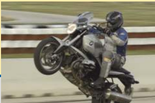
BMW R 1200 R